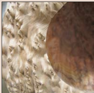
Eine Anleitung zur Herstellung einer Maser - Naturrandschale ohne Spannrezeß ab Seite 8