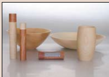
Eine Auswahl der Gesellenstücke 2008 ab Seite 16